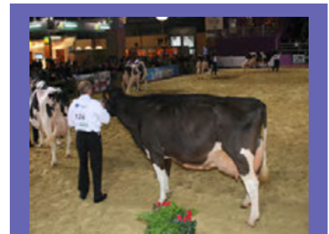
Udelac Lau dans le ring

Après Sissi, c'est Udelac Lau qui fut sacrée Meilleure Laitière au Salon de l'Agriculture de Paris. Après avoir remporté le titre de Meilleure Laitière au régional et au départemental et produit près de 80 000 kg de lait en 5 lactations cette fille de Stormatic fait la satisfaction de son propriétaire, le Gaec du Bon Espoir de la Loire-Atlantique.